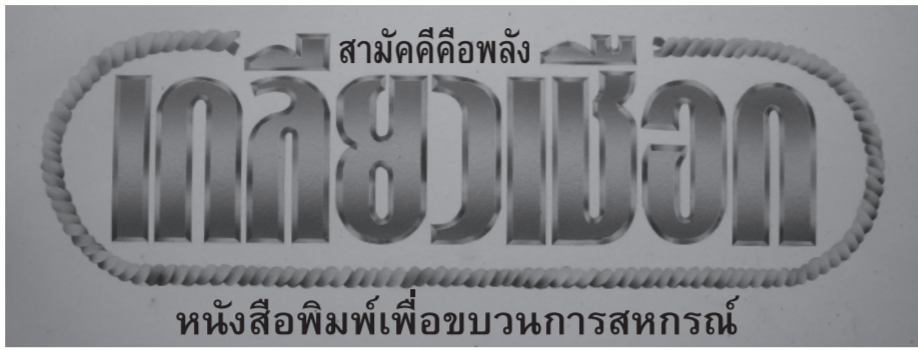
หนังสือพิมพ์เพื่อขบวนการสหกรณ์ ปีที่ ๒๘ ฉบับที่ ๓๔๗ วันที่ ๑๑-๑๓ มิถุนายน พุทธศักราช ๒๕๖๔ ราคา ๑๐ บาท