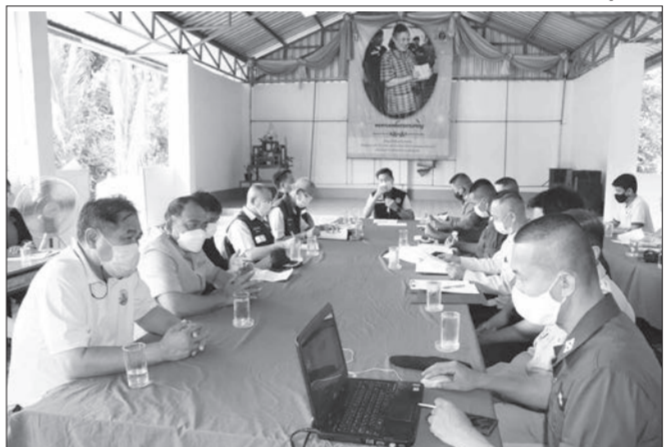
วราวุธ มีชัย/ภาพข่าว/ทีมงานประชาสัมพันธ์/สำนักงานสหกรณ์จังหวัดพิษณุโลก

ต่างๆ ของโรงเรียน การเยี่ยมชมกิจกรรมสหกรณ์นักเรียน กิจกรรมการบันทึกบัญชี กิจกรรมโครงการอาหารกลางวัน การปลูกผัก และการเลี้ยงสัตว์ เป็นต้น พร้อมทั้งได้หารือแนวทางเพื่อให้การเตรียมงานรับเสด็จเป็นไปด้วยความเรียบร้อยและสมพระเกียรติต่อไป