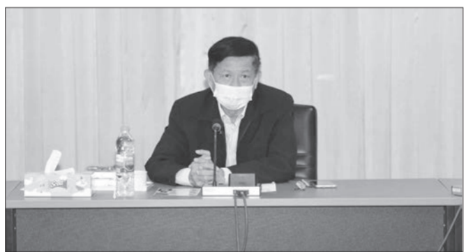
สุภกร ชาญศิริวิบูลย์ สรุป / เรียบเรียง

ท้ายนี้ นายเอก ได้กล่าวเชิญชวนสหกรณ์ที่ยังไม่ได้เป็นสมาชิกขอให้สมัครเข้ามาเป็นสมาชิกเพื่อประโยชน์ที่จะได้รับเมื่อเป็นสมาชิกกองทุนสำรองเลี้ยงชีพฯ แล้ว เช่น นำไปลดหย่อนภาษีประจำปีได้และเป็นสวัสดิการที่ได้เงินเพิ่มเมื่อออกจากงาน หรือเกษียณอายุ เสมือนได้รับค่าจ้างเพิ่มขึ้น จากเงินสมทบที่นายจ้างจ่ายให้ เป็นโอกาสในการออมเงินแก่ครอบครัวเพิ่มขึ้น เงินออมอยู่ภายใต้การบริหารโดยมืออาชีพ และได้รับสิทธิประโยชน์ทางภาษี.