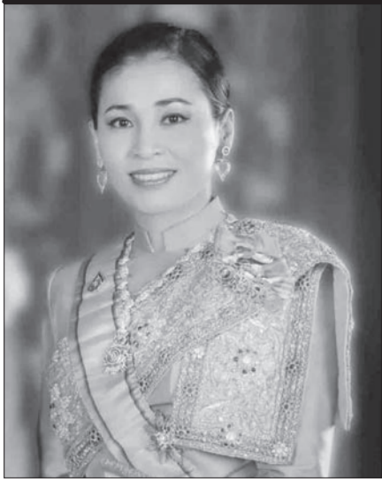
ทรงพระเจริญ เนื่องในโอกาสวันเฉลิมพระชนมพรรษา สมเด็จพระนางเจ้าฯ พระบรมราชินี ๓ มิถุนายน ๒๕๖๔ ด้วยเกล้าด้วยกระหม่อม ข้าพระพุทธเจ้า น.ส.ท.เกลียวเชือก และคณะ