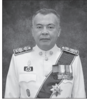
อธิบดีกรมตรวจบัญชีสหกรณ์ เนื่องในโอกาสครบรอบ ๒๘ ปี หนังสือพิมพ์เกลิยวเชือก