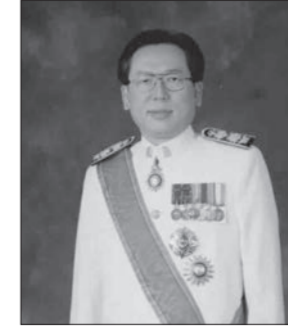
สารอำนวยการ

ขบวนการสหกรณ์มีการเปลี่ยนแปลงไปตามสถานการณ์ของโลก ต้องปรับตัวให้ทันต่อยุคสมัย อยู่ตลอดเวลาจึงอยู่รอดได้ แต่สิ่งที่ไม่เปลี่ยนคือ อุดมการณ์ หลักการสหกรณ์ที่ ต้องยึด ปฏิบัติให้มั่นคง ไม่เช่นนั้น หากคิดเพียง จะส่งผลกระทบต่อความเชื่อมั่นและในที่สุด อาจไม่สามารถดำรงอยู่ได้ ฉะนั้น ฉะนั้น สื่อสิ่งพิมพ์ฉบับเดียว คือ เกลิยวเชือก ยึดอุดมการณ์ ในการทำงานมาตั้งแต่ปี 28 ถือเป็นเรื่องไม่ยากนัก ที่ยังคงสื่อสาร งานสหกรณ์อย่างต่อเนื่อง ยาวนาน