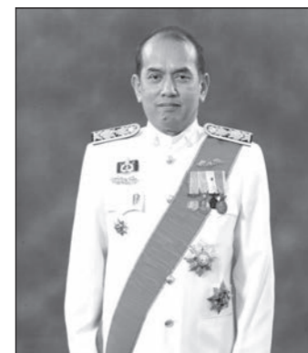
สารอำนวยพร จากประธานกรรมการดำเนินการสันนิบาตสทรณแห่งประเทศไทย

เนื่องในวาระครบรอบ ๒๘ ปี ของหนังสือพิมพ์เกลียวเชือก ผมขอแสดงความยินดี และขอชื่นชม “หนังสือพิมพ์เกลียวเชือก” ที่ได้มุ่งมั่นทำหน้าที่ในฐานะสื่อมวลชนที่ดีมาโดยตลอด ด้วยการนำเสนอข้อมูลข่าวสารที่มีคุณค่าแก่ผู้อ่านอย่างตรงไปตรงมาและสร้างสรรค์ อีกทั้งยังมีบทบาทสำคัญยิ่งในการสะท้อนข้อคิดเห็น และความจริงที่เกิดขึ้นในขบวนการสทรณไทยอย่างถูกต้อง และเที่ยงธรรม