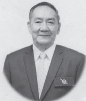
สารจากประธานกรรมการชุมนุมสทรณออมทรัพย์ตำรวจแห่งชาติ จำกัด เนื่องในโอกาสครบรอบ ๒๘ ปี หนังสือพิมพ์เกลียวเชือก

หนังสือพิมพ์เกลียวเชือก เป็นหนังสือพิมพ์สำคัญฉบับหนึ่งที่นำเสนอข่าวสารของวงการสทรณ และเป็นสื่อกลางในการเผยแพร่ข้อมูลข่าวสารต่าง ๆ ของขบวนการสทรณไทย เพื่อให้สมาชิกสทรณและประชาชนทั่วไป ได้รับทราบเนื้อหาสาระ ความรู้ ความเข้าใจ ที่จะนำหลักและวิธีการสทรณ ไปช่วยพัฒนาสังคมไทยให้เป็นสังคมที่น่าอยู่อย่างแท้จริง