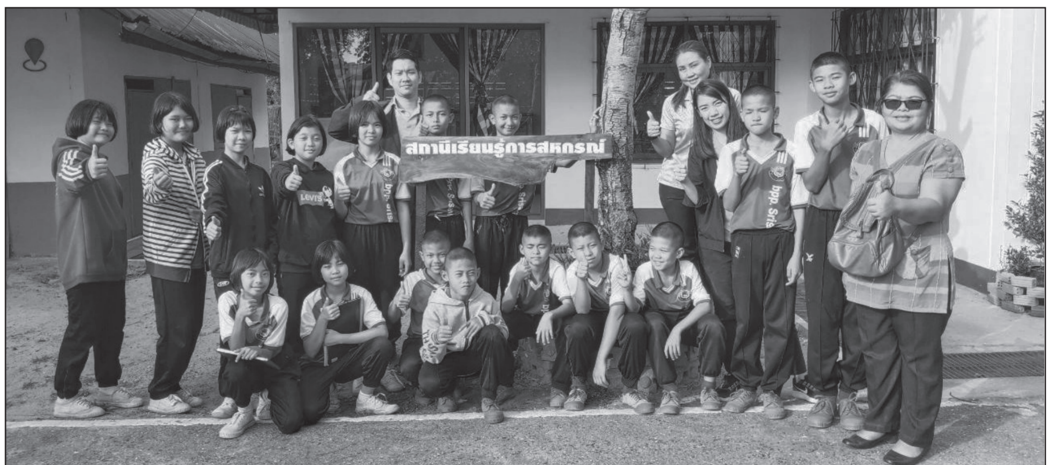
ภาพข่าว : ทีมประชาสัมพันธ์สำนักงานสหกรณ์จังหวัดยโสธร

และแนะนำให้มีการจัดการประชุมคณะกรรมการสหกรณ์ นักเรียนเป็นประจำทุกเดือน เพื่อที่จะได้ทราบว่าการ ผลการ ดำเนินงานกิจกรรมสหกรณ์ร้านค้า มีผลกำไร ขาดทุน เท่า ไร? เพื่อนำข้อมูลมาใช้ปรับปรุงและพัฒนาสหกรณ์ร้านค้า ของโรงเรียนให้ดีขึ้น ซึ่งนอกจากจะทำให้สหกรณ์ร้านค้ามี กำไรในการดำเนินกิจการแล้ว นักเรียนเองก็ยังมีความรู้เรื่อง ของระบบร้านค้า ซึ่งเป็นพื้นฐานที่สำคัญในการนำไปประยุกต์ ใช้ในการประกอบอาชีพต่อไปได้ พร้อมทั้งเลี้ยงไอศกรีม แก่นักเรียนและบุคลากรของโรงเรียน ณ โรงเรียนตำรวจ ตระเวนชายแดนบ้านศรีสวัสดิ์ อำเภอเลิงนกทา จังหวัดยโสธร